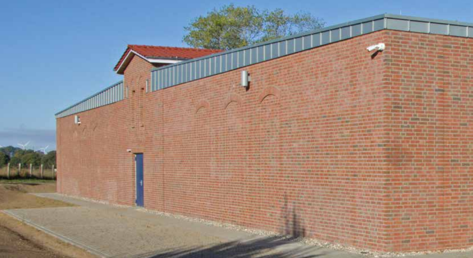
Abb.: Der neue Trinkwasserspeicher am Wasserwerk Groß Schönwalde.